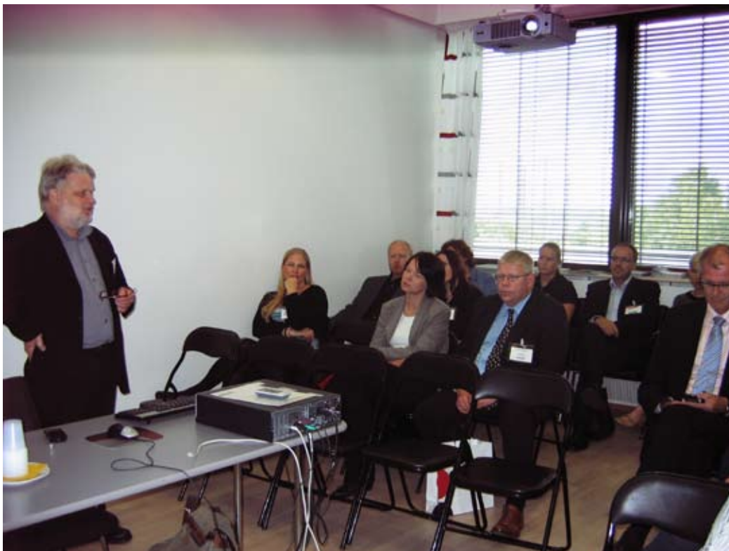
TPY:n tietoisuudessa Kuntamarkkinoilla pohdittiin: Kannattaako työvalmennus?

Toiminnanjohtaja oli rikosseuraamusviraston järjestämässä seminaarissa esittelemässä työpajatoimintaa vankeinhoidon henkilöstölle ja ministeriön virkamiehille 23.9.2009. Hän toimi puheenjohtajana Allianssi ry:n syyskokouksessa 10.11.2009.