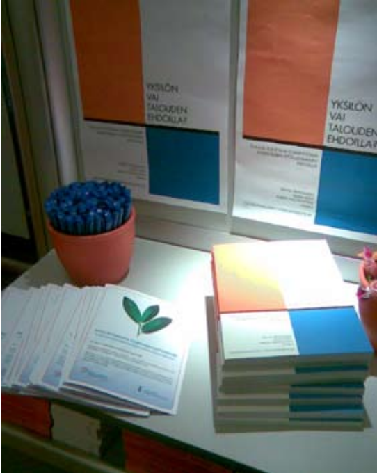
Palvelutori-hanke esittäytyi Kuntamarkkinoilla