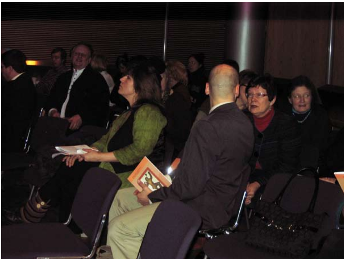
Starttivalmennuksesta taiteen keinoin –kirjan julkistaminen eduskunnan kansalaisinfossa 25.2. kiinnosti työpajatoimijoita ja päättäjiä

”Työttömyyttä, syrjäytymistä ja kokopäiväpassiivisuutta” vastustava Legioonoateatteri esitti oman kannanottonsa teatterin keinoin. Tilaisuus kokosi paikalle innostuneesti keskustelleita työpaja-ammattilaisia, sosiaalisen työllistämisen kentän toimijoita ja päättäjiä.