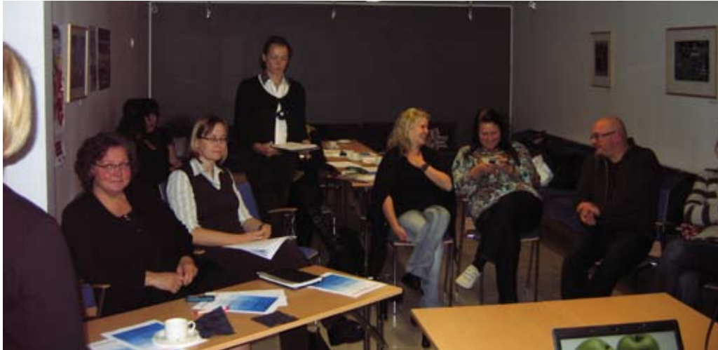
Starttiverkosto kokoontui syyskuussa Allianssi-talossa Pasilassa

Valtakunnallinen työpajayhdistys ry:n jäsentoiminnan tarkoituksena on koota kentältä nousevia tarpeita ja tuottaa jäsenistölle sen yleistä kehittymistä tukevia ja työpajatoimintaa edistäviä palveluja. Jäsenpalveluja pyritään kehittämään jatkuvasti vastaamaan paremmin sekä toimialan yleistä että jäsenkentän kehitystä. Yhdistyksen sisällä jäsenpalveluprosessista vastaa järjestöpäällikkö. TPY:n jäsenpalveluihin kuuluvat alueellinen ALU-verkostotoiminta, starttivalmennus- sekä taide- ja kulttuuriverkostojen koordinointi sekä Valtakunnallisten työpajapäivien, erilaisten teemapäivien ja Ihanko Pihalla? -työpajanuorten taide- ja kulttuuritapahtuman organisointi.